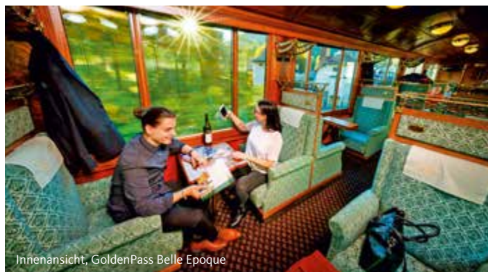
Innenansicht, GoldenPass Belle Epoque

„Sie dürfen gerne einsteigen... Nein es kostet Sie keinen Zuschlag... Ja, der Swiss Travel Pass ist gültig sowie alle anderen Fahrscheine.... Eine Platzreservierung ist empfohlen aber nicht obligatorisch“. Dies sind Antworten auf Fragen der Gäste, wenn sie den Zug sehen und es kaum wagen einzusteigen, da sie denken der Geldbeutel werde dann belastet.