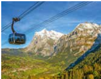
Oben: Jungfrauoch Unten: Eiger Express

Hochalpine Wunderwelt aus Eis, Schnee und Fels