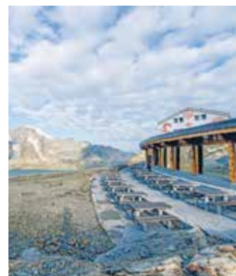
Oben: Rigi Unten: Berghaus Diavolezza