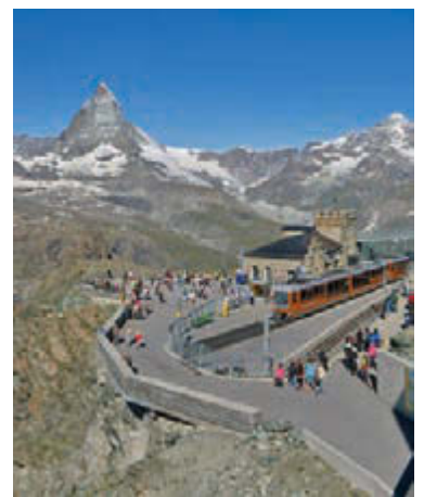
Oben: Stellisee Unten: Gornergrat