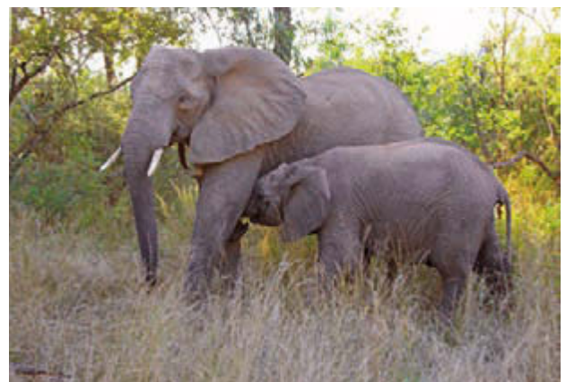
Oben: Blue Train, Deluxe-Suite; Mitte links: African Explorer, Emerald Kabin; Mitte rechts: Blue Train, Kabinenservice; Unten rechts: Elefanten