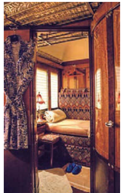
Linke Seite: Usbekistan, Sonderzug Orient Silk Road Express Oben: Deccan Odyssey, Speisewagen; Unten: Venice Simplon-Orient-Express, Kabinenbeispiel