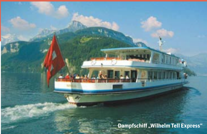
Dampfschiff „Wilhelm Tell Express“